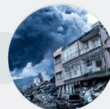
Earthquake in Chile in the next 3 years

Insurance-linked securities (ILS) in the form of a Catastrophe Bond