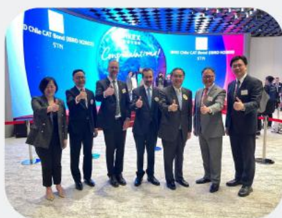
USD350 million Catastrophe Bond by World Bank issued and listed in Hong Kong in March 2023

Insurance-linked securities (ILS) allows the issuer to transfer risk and receive payment upon specific events e.g. natural disasters.